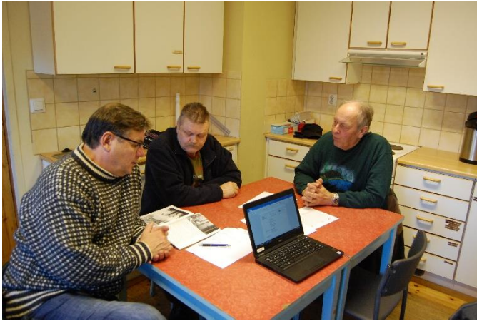
Kuva 3 Koiviston seurojentaloa hallinnoi kolme eri yhdistystä