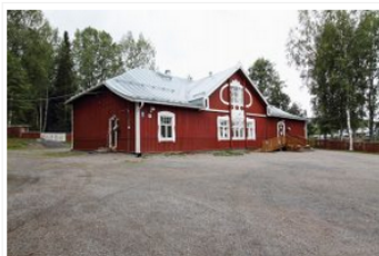
Jyväskylän seudun NS:n talo, Keljon Tapiola

Tilavaraukset- ja vuokraukset hoidetaan Keljon Tapiolan toimiston (avooina klo 9-15) kautta joko puhelimitse 040 765 5006 tai sähköpostitse jklseudunns@gmail.com tai nettilomakkeen kautta https://www.jyvaskylanseudunnuorisoseura.fi/lomake.html?id=1