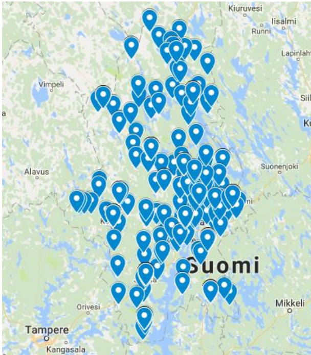
Kuva 1 Kartoitettut kiinteistöt

Kiinteistöjen tiedot kerättiin excel-muotoiseen rekisteriin, joka hankkeen päätyttyä jaettiin keskeisille yhteistyökumppaneille (ilman henkilötietoja). Kartoitust materiaalia voidaan hyödyntää esimerkiksi opinnäytetöiden tausta-aineistona tai uusien maakunnallisten hankkeiden lähtötilanteen arvioinnissa.