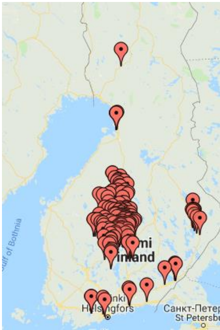
Kuva 6 Toimeksi.fi-palvelussa olevat toimitilat 24.3.2018.

Yhdistystorille ja Toimeksi.fi:n tietopankkiin tehtiin myös toimitila-osio, jossa on tietoa ja opasmateriaaleja liittyen toimitilojen ylläpitoon. Kaikkiaan toimitiloihin liittyvillä sivuilla oli hankkeen aikana yli 2000 sivukatselua.