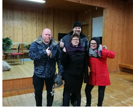
Kuva 4 Kinnulan seurojentalon selvityskortin täyttäjät olivat tyytyväisiä

Selvityskortti on luonteeltaan itseohjaava ja yhdistykset voivat ladata ja täyttää sen omatoimisesti, mutta hanketyöntekijä toimi selvityskorttitilaisuuksissa kirjurina. Selvityskortista sai sitä enemmän irti, mitä useampi osallistuja tapahtumassa oli ja mitä aktiivisempaa keskustelu selvityskortin osa-alueista oli. Selvityskortin osittaisena tarkoituksenakin on herättää kysymyksiä: osa kysytyistä asioista oli selkeästi sellaisia, ettei niitä ole tullut kukaan ajatelleeksi – selvityskorttitilaisuudessa usein päätettiin, että juuri se asia laitetaan heti seuraavaksi kuntoon.