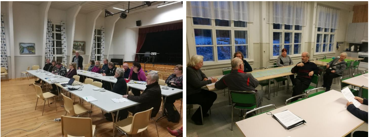
Kuva 7 ja 8: Seututilaisuuksissa keskustellaan. Venekoski, Hankasalmi ja Oinoskylä, Karstula

Hankkeen aikana järjestettiin seutukunnallisia tilaisuuksia, joissa yhdistykset saivat tietoa kiinteistöjen ylläpidosta ja pääsivät keskustelemaan ja verkostoitumaan. Seututilaisuuksia järjestettiin pääasiassa yhteistyössä muiden keskuomalaisten toimijoiden kanssa.